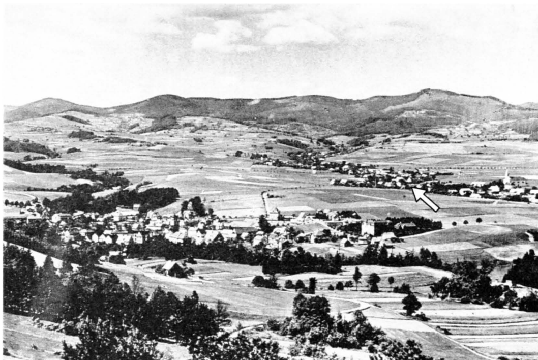
Obr. 1 Dobový pohled přes Frýdberk na Skorošice a Rychlebské hory. Šípkou je vyznačeno přibližné místo s domem rodiny Reinoldových (DRESSEL, K. a kol.: Gurschdorf)

Vyjma jednoho evangelíka a čtyř osob bez formální náboženské příslušnosti se všichni místní obyvatelé hlásili k římskokatolické církvi. 5 Základ živobytí zdejšího obyvatelstva tvořilo zemědělství. Velkou tradici však měla i těžba žuly. V okolí obce bylo v provozu téměř deset lomů, které živily několik desítek lamačů kamene, kameníků a dalších profesí. Místní lesy představovaly stabilní základnu pro zpracování dřeva, díky čemuž tu v meziválečném období fungovaly dvě pily. Tradici si držela i výroba lněného zboží. 6